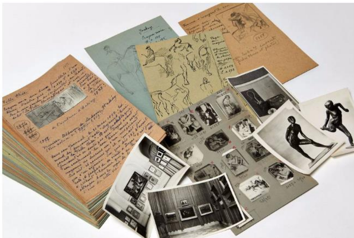
Edgar Degas, Ensemble inédit de documentation rassemblée par Paul-André Lemoine sur l'œuvre dessinée d'Edgar Degas pour la période 1860 – 1890 (estimation : 6 000 – 8 000 € / 6 500 – 8 700 $)

Paris - La vente de livres et manuscrits modernes du 22 juin prochain comprendra plus de 200 lots qui seront dispersés sous le marteau de François Tajan.