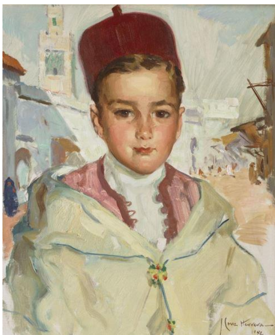
José Cruz Herrera, Le jour de l'Aïd , 1942

La peinture marocaine des années 1950 est aussi représentée avec des artistes tels que Roger Limouse ou Hassan el Glaoui.