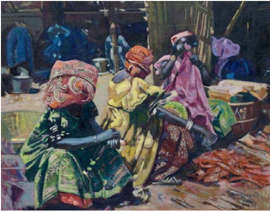
Jacques Majorelle, Dakar , 1953 Huile sur toile marouflée sur panneau 50,50 x 65 cm Estimation : 70 000 – 110 000 € / 75 000 – 117 000 €

Concentrant sa composition sur les trois femmes accroupies devant leur étalage de marchandise, à l'instar d'un touriste debout photographiant une scène de marché, l'artiste choisit de peindre son sujet en gros plan, en pleine lumière, pour mettre en valeur la richesse et la variété des étoffes dont elles sont revêtues. Au second plan, des ombres colorées suggèrent la présence d'autres femmes près de leur bassin.