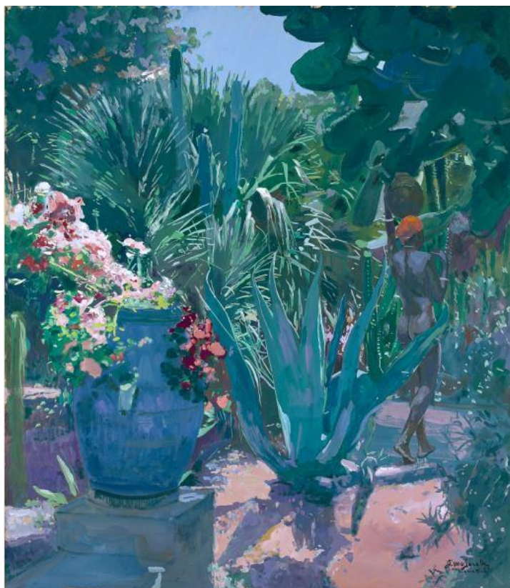
Jacques Majorelle, Nu dans les jardins Majorelle , gouache sur papier marouflé sur panneau, 88 x 77,5 cm (estimation : 80 000 – 150 000 € / 85 000 – 160 000 $)

Paris – Après le succès de deux ventes thématiques qui ont successivement mis l'accent sur la création artistique du Maroc (vente Moroccan Spirit : 1874 – 2014 , en novembre dernier), et de l'Algérie (vente d'une collection privée, Regard sur l'Algérie , en février 2015), Artcurial organise le 12 mai 2015 sa traditionnelle vente Orientalisme. Les 67 œuvres offertes aux enchères dressent un panorama complet de ce courant artistique.