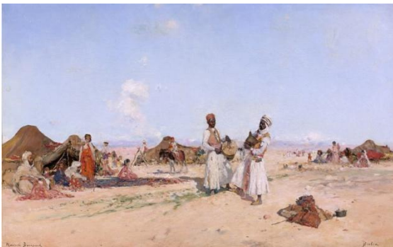
Maurice Bompard, Fête à Biskra Huile sur toile 56,40 x 90 cm Estimation : 50 000 – 70 000 € / 53 000 – 75 000 $

Les motifs architecturaux interprétés par l'artiste sont stylisés de même que le paysage. Le dessin est précis, la palette colorée restreinte, jouant des contrastes et exprimant la lumière. La composition est étagée par plans, sans utilisation de la profondeur.