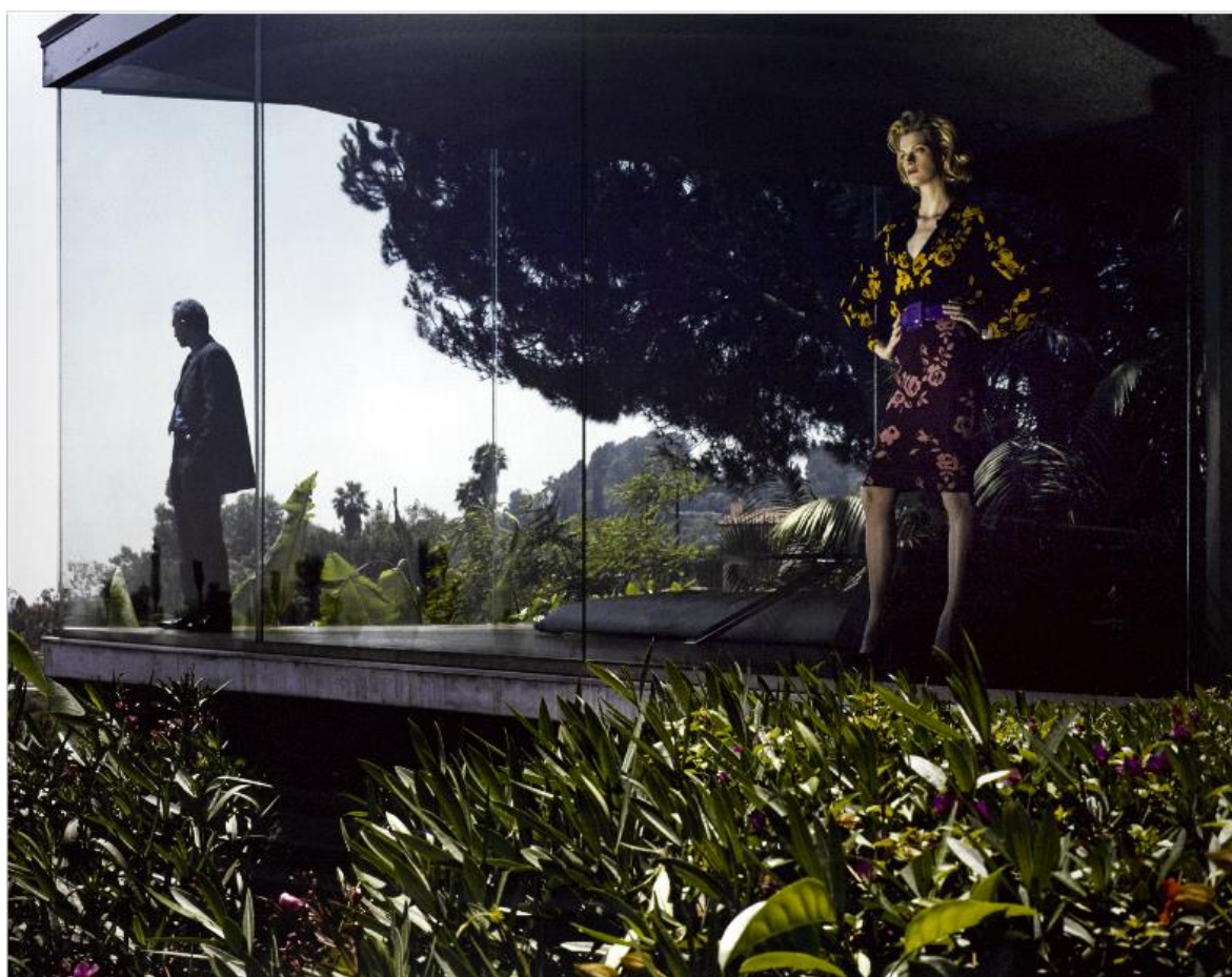
Philip Lorca Di Corcia, W. September #3 , 1997, 122 x 152,50 cm (estimation : 20 000 – 25 000 € / 23 000 – 29 000 $)

Paris – Suite à l'inauguration en mai dernier du département Photographie, le succès des premières vacations a confirmé le potentiel d'attraction d'Artcurial dans ce domaine. La maison a su répondre au goût éclectique des collectionneurs, notamment avec un choix important de photographes contemporains. Pour sa première vente de l'année, le lundi 29 juin, Artcurial met à l'honneur des œuvres photographiques du XX e et XXI e siècles, à travers 170 lots. Un programme complet qui convoque les grands noms de l'art de la photographie comme Helmut Newton et Robert Mapplethorpe, mais aussi des artistes contemporains comme Philip Lorca Di Corcia, Valérie Belin ou encore Philippe Ramette.