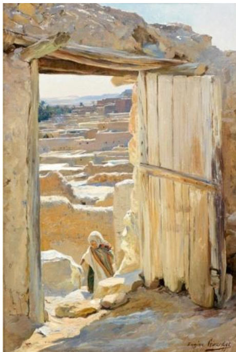
Eugène Girardet, Porte ouverte sur Bou-Saâda , 1881, Huile sur panneau (estimation : 25 000 – 30 000 € / 33 000 – 40 000 $)