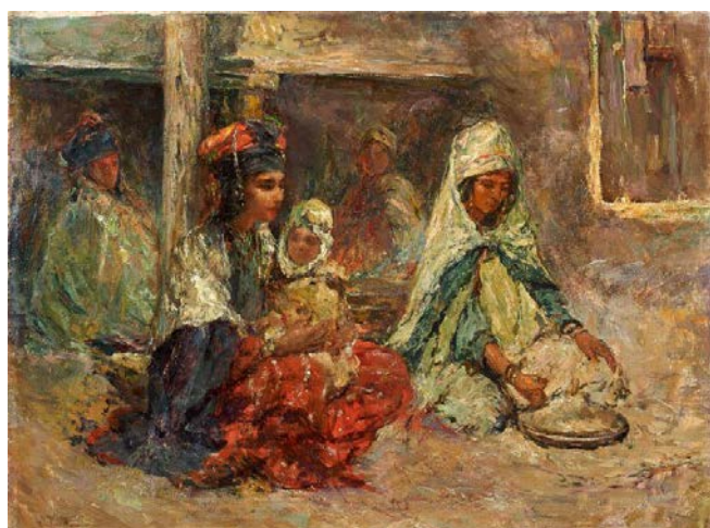
Edouard Verschaffelt, La préparation du couscous , Huile sur toile (estimation : 15 000 – 20 000 € / 20 000 – 26 500 $)