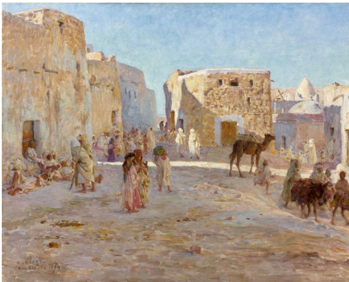
Etienne Dinet, Une place à Bou-Saâda , 1894, huile sur toile, 65,5 x 82 cm (estimation : 200 000 – 300 000 € / 265 000 – 395 000 $)

Paris – Après le succès de la vente Moroccan Spirit : 1874 – 2014 , en novembre dernier, Artcurial met à l'honneur un autre pays du Maghreb : l'Algérie. Le 10 février prochain, c'est ainsi une collection remarquable de plus d'une cinquantaine de tableaux orientalistes, tous liés à l'Algérie, qui sera offerte aux enchères. Cet ensemble, conservé jusqu'à présent en mains privées, retrace un siècle de création, de 1830 à 1930.