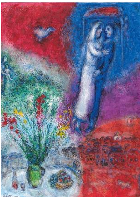
Marc Chagall, Les mariés , 1979, détrempe sur masonite, 110 x 80 cm.

- DU 5 DECEMBRE 2014 AU 20 JANVIER 2015 -