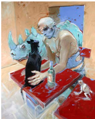
Bilal Enki (Né en 1951) Bleu Sang Acrylique sur toile. Signé et daté "94" 98,50 x 79 cm (38,42 x 30,81 in.) Estimation : 100 000 – 150 000 € (130 000 – 190 000$)