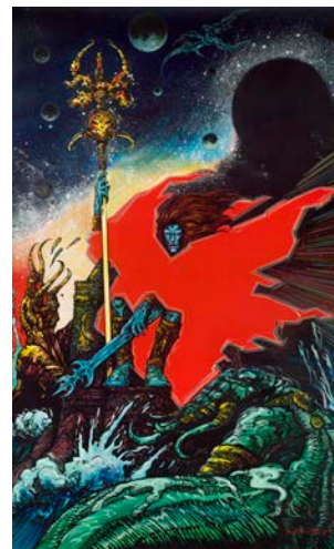
Druillet Philippe (Né en 1944) Yragaël Acrylique sur toile. Signé et daté "93" en bas à droite 257 x 160 cm (100,23 x 62,40 in.) Estimation : 120 000 – 150 000 € (150 000 – 190 000$)