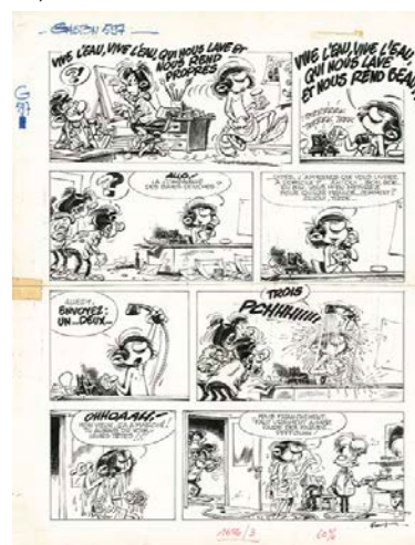
Franquin André (1924 – 1997) Gaston Lagaffe Encre de Chine pour le gag 597 prépublié le 8 janvier 1970 dans le journal Spirou n°1656. Signé 45,20 x 34,50 cm (17,63 x 13,46 in.) Estimation : 70 000 – 90 000 € (88 000 – 114 000$)