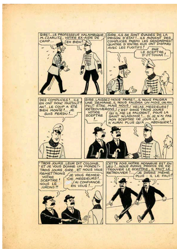
HERGÉ Georges Remi dit (1907 – 1983)

- VENTE LE SAMEDI 22 NOVEMBRE 2014 A 11H ET 14H -