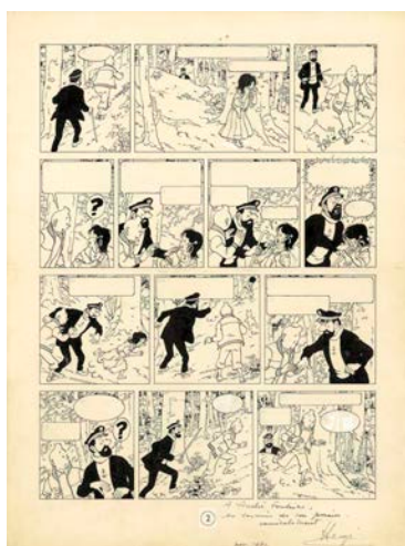
HERGÉ Georges Remi dit (1907 – 1983) Tintin – Les Bijoux de la Castafiore Encre de Chine pour la planche 2 de cet album publié en 1963 aux éditions Casterman. Signé et enrichi d'une dédicace 47,70 x 35,50 cm (18,60 x 13,85 in.) Estimation : 250 000 – 350 000 € (319 000 – 406 000$) Copyright Hergé / Moulinesart 2014