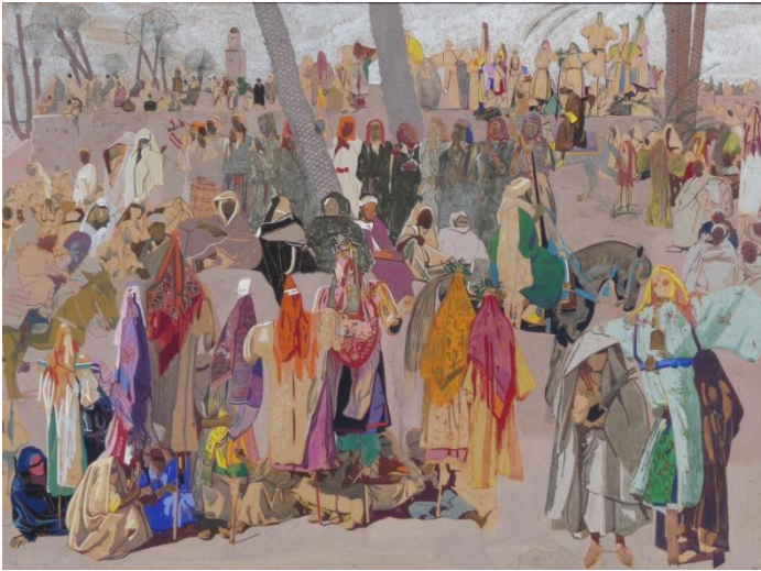
Jacques MAJORELLE (1886-1962), Les Allamattes , circa 1931, Gouache et détrempe Estimation : 150 000 – 200 000 € / 200 000 – 270 000 $