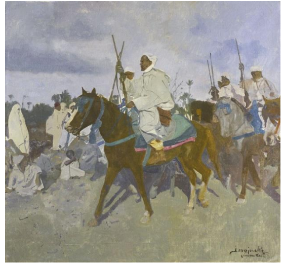
Jacques MAJORELLE (1886-1962), Le retour de la fantasia, Marrakech , Huile sur toile Estimation : 120 000 – 150 000 € / 160 000 – 200 000 $