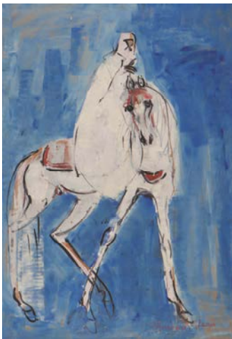
Hassan EL GLAOUÏ (1923-) Cavalier Gouache sur isorel Estimation : 15 000 – 20 000 € / 20 000 – 27 000 $