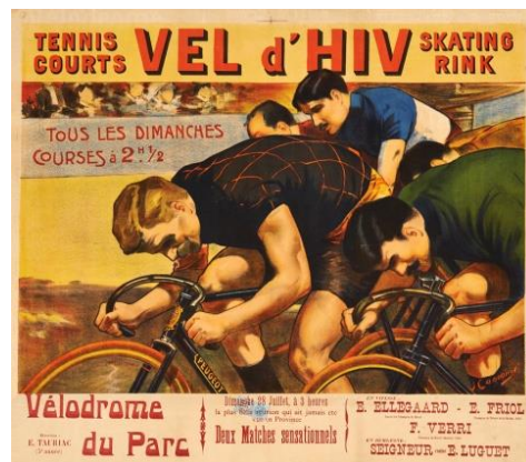
Jacques Cancaret, Vel d'Hiv 68,5 x 78,5 cm Estimation : 800 – 1 000 € / 1 000 – 1 300 $