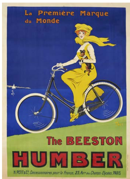
Walter Thor, The Beeston Humber , 140 x 100 cm (estimation 400 – 500 € / 525 – 650 $)