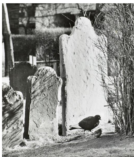
André Kertész, Les deux amis, New York

S'il expose à New York dès 1932, avec la galerie Julien Levy, il ne part définitivement pour l'Amérique qu'en 1936. Il ne devait séjourner que le temps d'un travail pour Keystone, mais la seconde guerre mondiale approche et il décide de rester aux Etats-Unis. Il collabore là-bas avec de nombreux titres américains, mais son intransigeance artistique lui ferme la porte de plusieurs publications. André Kertész tombe malade en 1963 et décide de rompre son contrat avec les éditions Condé Nast. Il est désormais libre de se consacrer comme il l'entend à son art. La reconnaissance internationale ne se fait pas attendre et il fait l'objet d'une exposition monographique dès 1964 au MoMA. Il décède en 1985.