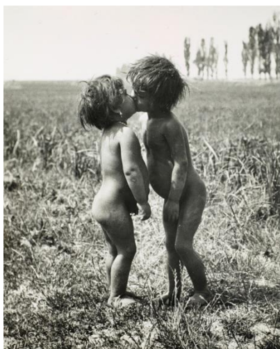
André Kertész, Enfants tziganes s'embrassant, Esztergom, 27 Juin 1917 , tirage argentique, 24,6 x 19,6 cm (estimation 1 000 – 2 000 € / 1 300 – 2 600 $)