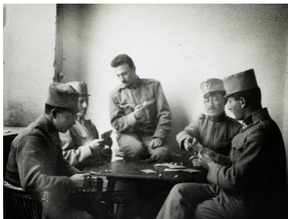
André Kertész, La partie de cartes

Issu d'une famille bourgeoise de Budapest, André Kertész achète son premier appareil photo en 1913, à l'âge de 19 ans. Il réalise ses premiers reportages dès 1917 : il est alors dans l'armée austro-hongroise et documente la vie militaire avec ses clichés. Premier succès : il remporte un concours organisé par un magazine hongrois. Son travail est rapidement remarqué : en 1919, ce sont des images d'André Kertész qui illustrent l'article défendant la place de la photographie comme « art » dans L'Art vivant .