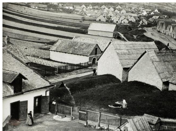
André Kertész, Celliers, Budafok, Hongrie 1919

Estimation : 1 000 – 1 500 € / 1 300 – 2 000 $