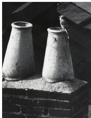
André Kertész, Washington Square, New York, 5 Novembre 1961 , tirage argentique, 24 x 19,1 cm (estimation 1 500 – 2 500 € / 1 300 – 2 600 $)

« À chaque fois que Kertész déclenche, je sens mon cœur battre »