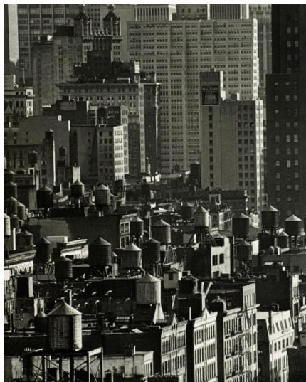
André Kertész, Building à New York

Estimation : 1 500 – 2 500 € / 2 000 – 3 300 $