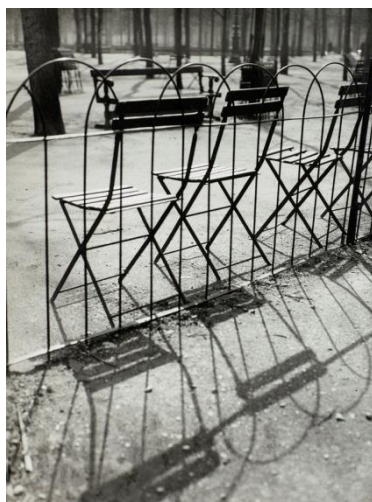
André Kertész, Jardins des Tuileries, 1927 , tirage argentique, 24,2 x 17,6 cm (estimation 3 000 – 4 000 € / 2 600 – 3 900 $)