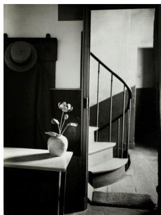
André Kertész, Chez Mondrian

À la fin de la 1 ère guerre mondiale, André Kertész sait qu'il veut faire de la photographie son métier. Il arrive à Paris en 1923, et intègre très rapidement le milieu artistique de l'époque. Il fréquente les personnalités parisiennes incontournables : Marc Chagall, Colette, Piet Mondrian... Le jeune photographe propose ses services à plusieurs magazines, notamment Bifur et VU . Il est le premier photographe à avoir une exposition monographique au Sacre du printemps en 1927.