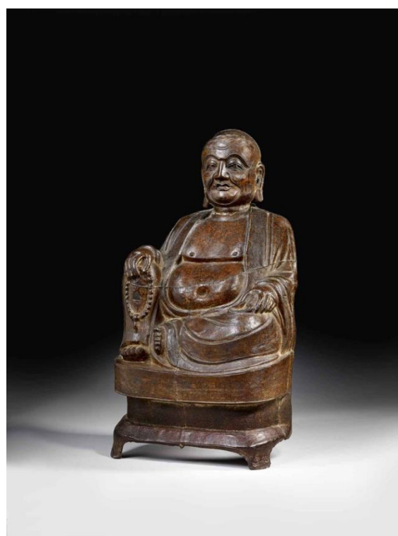
Statue de Bouddha, Chine, Dynastie Ming, XVe-XVIe siècle, Fonte de fer, Estimation : 10 000 – 15 000 € / 13 000 – 20 000 $

Paris – Porcelaine, jade et bronze, sont les principaux matériaux des œuvres et objets d'art qui seront offerts aux enchères le 8 décembre prochain lors de la vente Art d'Asie d'Artcurial. C'est au total près de 230 lots qui composent le catalogue de la vacation.