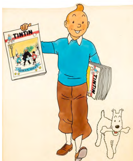
HERGÉ – Le journal de Tintin, illustration promotionnelle, circa 1950