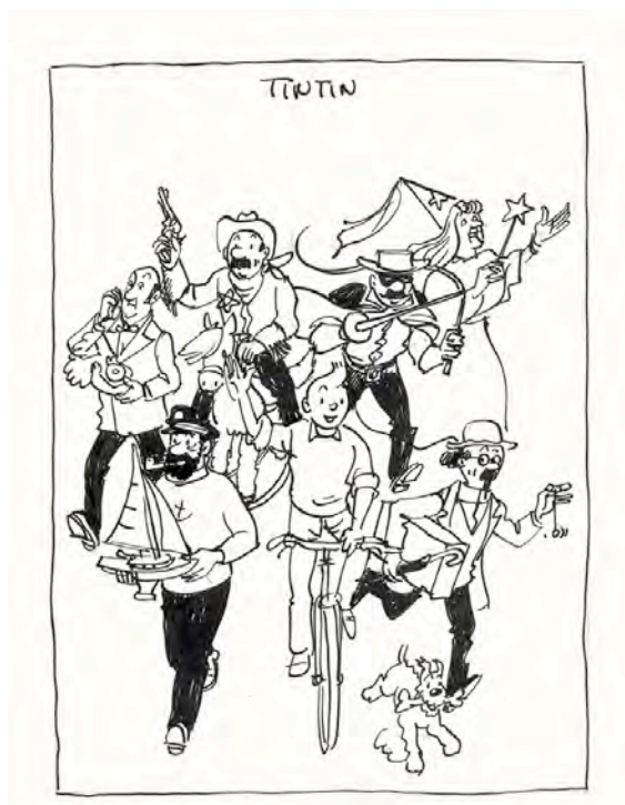
HERGÉ – Journal de Tintin, encre de chine pour un projet de couverture, 1978

Enfin cette vente se conclura par la mise en vente de plus de 250 produits dérivés de l'œuvre d'Hergé dont l'objet le plus ancien crée à partir du personnage de Tintin « l'épinglette Petit Vingtième », pin's offert pour un abonnement d'un an au journal Le Petit Vingtième, dès 1936.