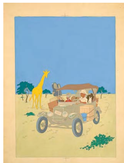
HERGÉ – Tintin au Congo, mise en couleur pour la couverture de l'album