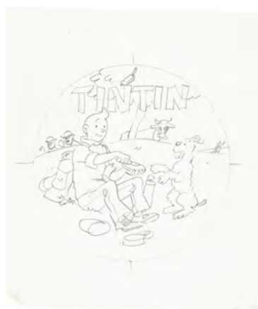
HERGÉ – Fromage Tintin, 1977