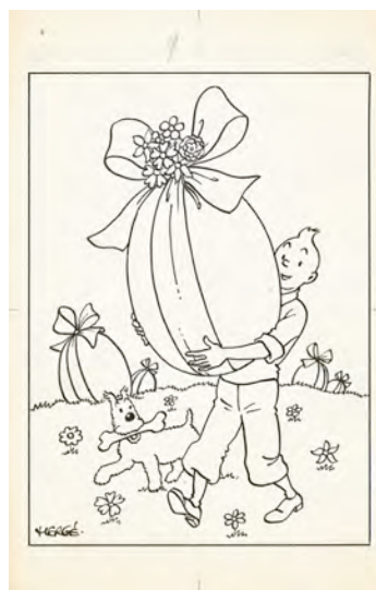
HERGÉ – Joyeuses Pâques, 1951

Parmi celles-ci, on remarque encore une importante couverture du journal Le Petit Vingtième pour la nouvelle année 1938 (estimée 40 000 €), représentant tous les héros créés alors par Hergé, une splendide illustration de Tintin portant un gigantesque œuf de Pâques (estimée 20 000 €) ou encore un rarissime ensemble représentant toutes les étapes de réalisation d'une campagne publicitaire faite par Hergé pour les fromages Tintin (estimée 45 000 €).