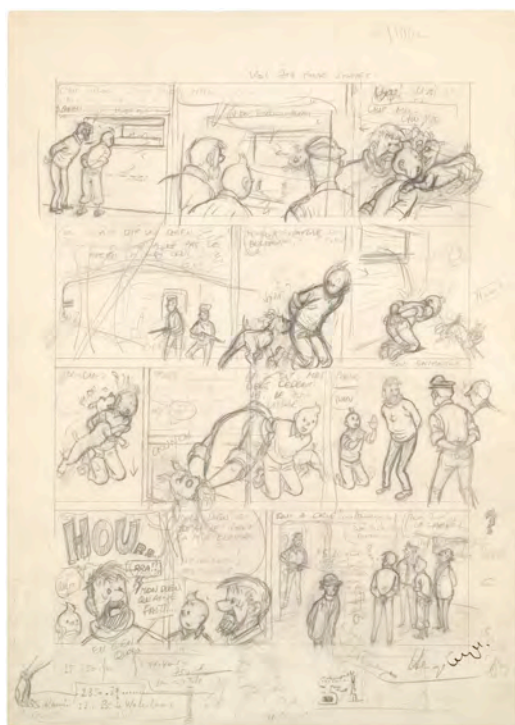
HERGÉ – Vol 714 pour Sydney, crayonné pour la planche 26, 1968