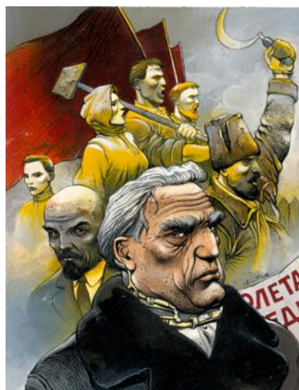
BILAL Enki (né en 1951) Partie de chasse

Encre de Chine, gouache de couleur et trame de gris pour la couverture du mensuel Pilote n°89, publié en 1981, annonçant la prépublication de l'album Partie de Chasse .