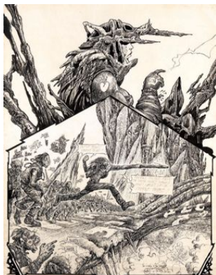
DRUILLET Philippe (né en 1944) La nuit

Encre de Chine et mine de plomb pour la planche 43 de cet album publié en 1976 aux éditions