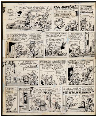
FRANQUIN André (1924-1997) Spirou et Fantasio

La suite de la vente réunira l'ensemble des auteurs du 9ème art, toutes catégories et époques confondues. On y découvrira une splendide planche de l'album de Franquin « Les petits-formats » édité en 1964 ainsi qu'un gag de Gaston représentatif de la justesse et de l'efficacité de l'auteur. On proposera également 3 planches de Bilal en noir et blanc des années 70, une case de Animal'z ou encore une magnifique photo rehaussée pour l'ouvrage Coeurs Sanglants, œuvre d'exception. David B, autre artiste naviguant entre l'Art Contemporain et le 9ème Art sera représenté avec une planche de la série Les chercheurs de trésors. Cette vente se poursuivra avec 2 planches de l'album manifeste La Nuit de Druillet ainsi qu'une double planche de Gail.