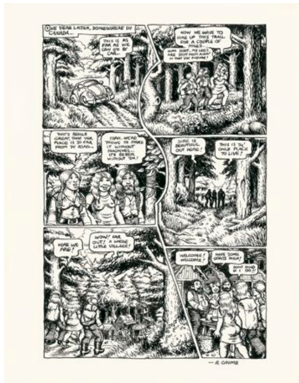
CRUMB Robert (né en 1943) Léonore Goldberg and her girl commando

Encre de Chine et aquarelle de couleur pour la couverture de l'album « Une Traversée Mouvementée », 3ème album de la série, publié en 2009 aux éditions Dupuis dans la collection Expresso. Signée. 29,7 x 21 cm. Estimation : 5 000 - 6 000 €