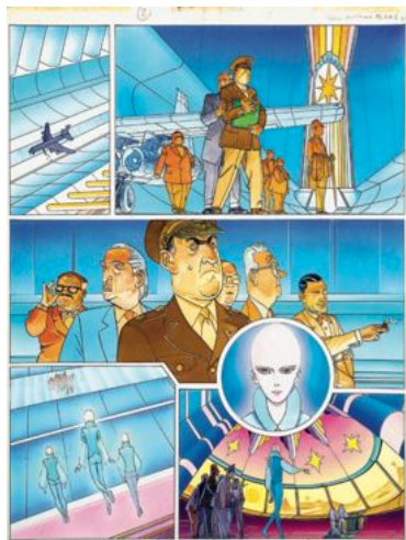
MOEBIUS Jean Giraud dit (né en 1938) Aedena

Encre de Chine et de couleur pour la planche 2 de cette histoire publiée dans le magazine L'Expansion au début des années 80 puis dans l'ouvrage « Venise Céleste » aux éditions Aedena en 1984. 44 x 34 cm.