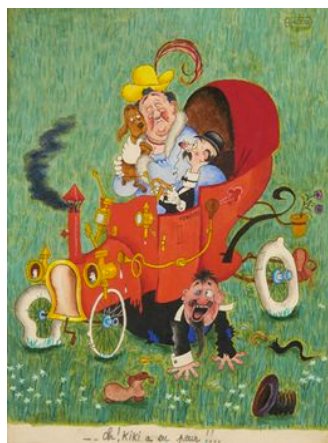
DUBOUT Albert (1905-1976) Oh ! Kiki a eu peur !!.

Fait remarquable dans un catalogue dédié à la bande dessinée, un chapitre sera consacré à l'artiste Dubout avec 3 illustrations d'exception en couleur, 2 en noir et blanc et une très rare peinture réaliste. Ces œuvres datent des années 40-50, la meilleure période de l'auteur.