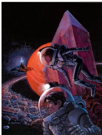
MÉZIÈRES Jean-Claude (né en 1938) Valérian et Laureline L'intégrale, volume 2

Encre de Chine et gouache de couleur pour la couverture de cet album publié en 2008 aux éditions Dargaud Signée à la gouache 43,5 x 33,5 cm