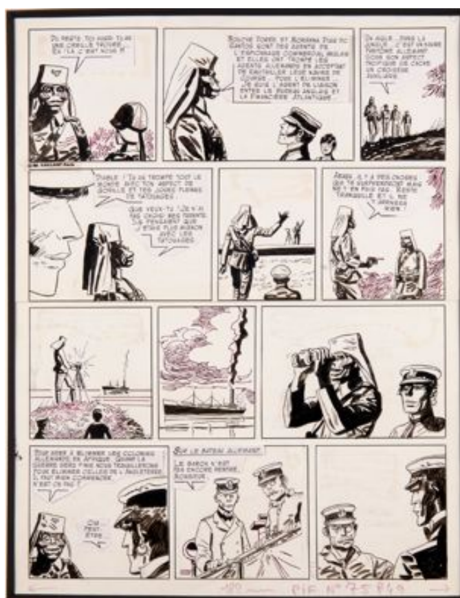
PRATT Hugo Corto Maltese

Parmi les insolites de ce catalogue, il est important de remarquer un superbe ensemble d'œuvres des studios Ghibli pour les films de Hayao Miyazaki, pièces incontournables de l'animation japonaise et des mangas.