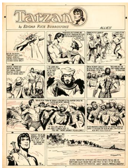
HOGARTH Burne (1911-1996) Tarzan

La bande dessinée américaine est à l'honneur avec des planches ou illustrations des maîtres anciens tels Herriman, Hogarth ou des maîtres actuels comme Crumb, Will Eisner et bien d'autres. Les auteurs de Comics sont représentés par des éditeurs aussi respectés que Bernie Wrightson, Jack Kirby...