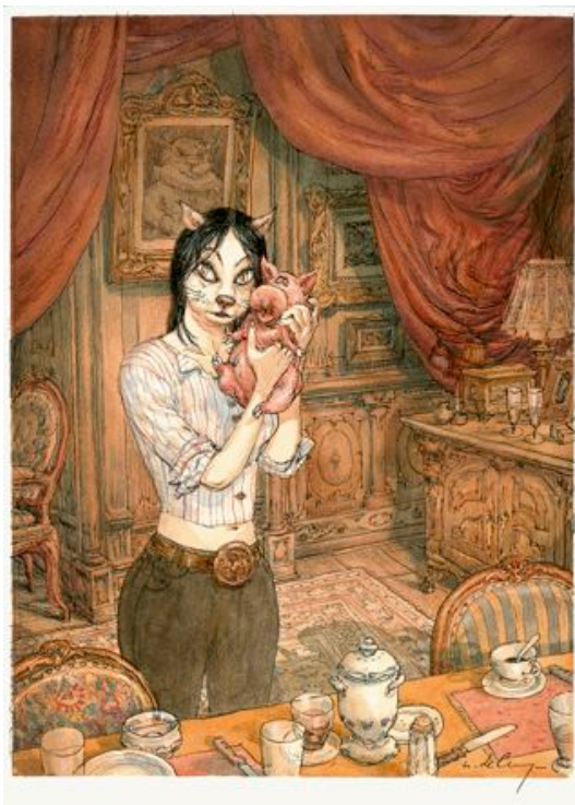
DE CRÉCY Nicolas (né en 1966) Salvatore

La Maison présentera également une planche des années 60 et une couverture des années 80 de Robert Crumb qui est devenu en quelques années l'une des coqueluches pour les œuvres d'art du mouvement Underground des années 60.