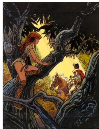
MÉZIÈRES Jean-Claude (né en 1938) Valérian et Laureline Les mauvais rêves

Encre de Chine et gouache de couleur pour la couverture de l'album « Les Mauvais Rêves », publié en 1983 puis en 2000 aux éditions Dargaud. Signée à la gouache. 36 x 28 cm.