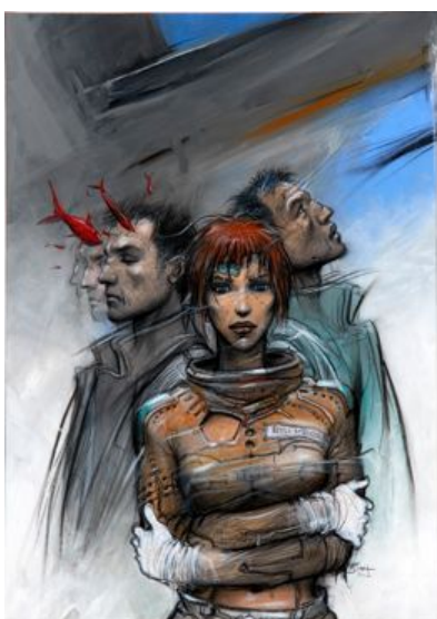
BILAL Enki (né en 1951) 32 décembre

Seront également présentées du même artiste l'une des cases les plus célèbres de ce cycle ainsi que 3 œuvres plus anciennes issues ou réalisées pour l'album mythique Partie de Chasse .