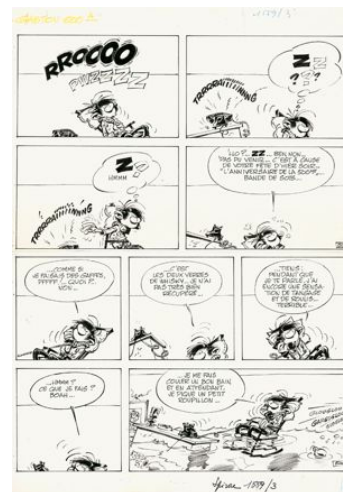
FRANQUIN André (1924-1997) Gaston Lagaffe

Encre de Chine pour le gag 500, publié dans l'album « Un gaffeur sachant gaffer », 7ème album de la série, publié en 1969 aux éditions Dupuis. Prépubliée dans le Journal Spirou n°1559 daté du 29 février 1968.