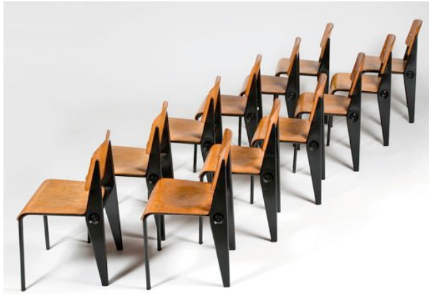
Lot 25 Jean PROUVE (1901 -1984) Ensemble de 12 chaises standard démontables dites "Cafétéria n°300" - création 1950 Tôle et tube d'acier plié relaqué noir et contreplaqué moulé (quelques sauts de placage) Fabrication Atelier Jean Prouvé Hauteur : 80 Largeur : 41 Profondeur : 47 cm Estimation 50 000 - 70 000 € Vendu 74 890 €