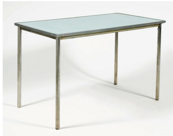
Lot 9 Charlotte PERRIAND, Pierre JEANNERET et LE CORBUSIER (1903-1999, 1886-1967 et 1903-1887-1965) Rare table - 1935 Plateau en bois recouvert d'une dalle de verre laquée bleue, ceinturée d'une cornière en aluminium et reposant sur une base en profilé d'acier en T laqué et quatre pieds rapportés en tube d'acier chromé. Edition Thonet Hauteur : 72,50 Largeur : 65 Profondeur : 110 cm