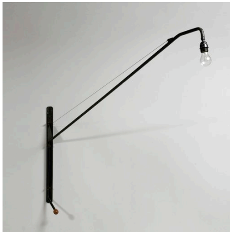
Lot 15 Jean PROUVE (1901 -1984) Potence d'éclairage n°602 - 1952 Tube d'acier laqué noir, tôle et fils d'acier laqué noir, bois Hauteur : 95 Largeur : 215 cm