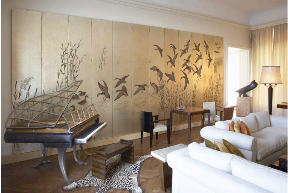
Salon comportant notamment le spectaculaire paravent de Jean Dunand – 372 300 € (est. 300 000-400 000 €) – et le piano crapaud de Poul Henningsen – 56 300 € (est. 50 000-60 000 €).