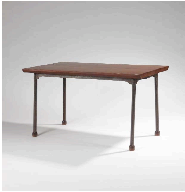
Pierre Chareau, Table pliante « Beauvallon », circa 1927, piètement en métal repliable, épais plateau en acajou massif à charnière centrale, piètement boule en acajou, numéroté et estampillé, 97 200 € (est. 80 000-100 000 €)