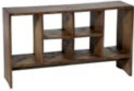
PIERRE JEANNERET 1896-1967 BIBLIOTHEQUE BASSE - CIRCA 1960 Bâti compartimenté à double face ouvertes. Sisso massif (palissandre indien). Haut. 70,5 cm - Long.121,5 cm - Prof. 37,5 cm Estimation 6 000 - 8 000 € Vendu 37 700 €