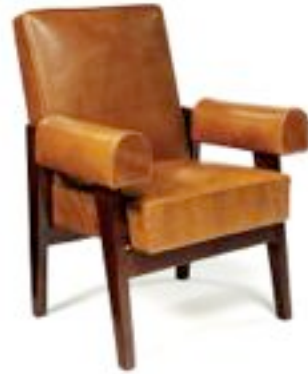
PIERRE JEANNERET 1896-1967 FAUTEUIL PUBLIC POUR LA HAUTE COUR - CIRCA 1955 Piètement fuselé en forme de pont formant support d'accoudoirs. Teck massif. Gainé à neuf de cuir de buffle fauve. Haut : 89 cm - larg : 64 cm - prof : 69 cm Estimation 3 500 - 4 000 € Vendu 26 561 €