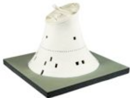
LE CORBUSIER (1887 - 1965) MAQUETTE DU " BOUCHON " DU TOIT DE L'ASSEMBLEE - CIRCA 1970 Plâtre armé et bois peint. Socle en contreplaqué peint. Haut. 81 cm - long : 114,5 cm - larg : 115,5 cm. (avec socle). Estimation 15 000 - 20 000 € Vendu 16 600 €