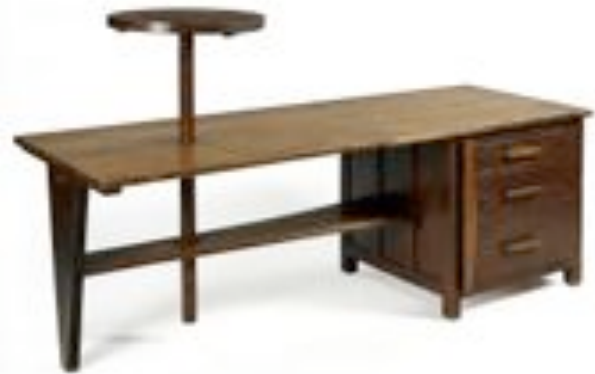
PIERRE JEANNERET (1896-1967) TABLE DE TRAVAIL POUR SCULPTEUR - CIRCA 1955 Plateau rectangulaire reposant d'un côté sur un unique et large pied fuseau raccordé au caisson à trois tiroirs par une large entretoise fuselée. Un percement circulaire dans le plateau et dans l'entretoise permet l'installation d'une sellette de sculpteur amovible. Plateau en bois naturel, le reste du meuble peint en brun, très belle patine d'usage. Cèdre massif. Haut : 72 cm - Plateau 200 cm x 66,5 cm Estimation 30 000 - 40 000 € Vendu 56 302 €