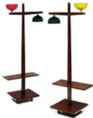
PIERRE JEANNERET 1896-1967 LAMPADAIRE - CIRCA 1955 Pied central fuselé fixé sur un socle, équipé d'une étagère asymétrique en partie basse et d'une double potence munie à chaque extrémité d'un abat jour en aluminium laqué, l'un rouge et l'autre noir, orientés vers le plafond et vers le sol. Teck massif. Modèle rare et fragile dont très peu d'exemplaires ont été préservés. Haut : 169 cm - Base : 72 x 42,5 cm Estimation 8 000 - 10 000 € Vendu 46 389 € (un seul)