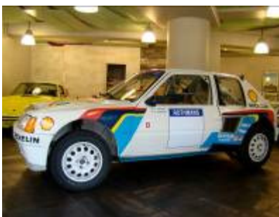
205 Turbo 16 de 1984

Première voiture conçue par Ettore Bugatti, qui en vendit le concept et les plans à la firme de Beaulieu, une Peugeot BB de 1913 très bien restaurée a été adjugée 20 300€ alors qu'une Torpedo de 1911 dans son jus atteignait la somme de 51 000€ .