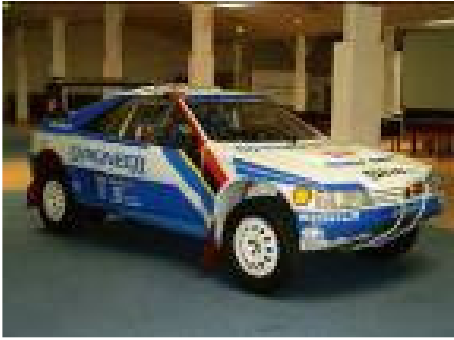
405 T Grand Raid

Par ailleurs, les maquettes de présentation des F1 Jordan et Prost ont été adjugées dans une fourchette de 12 000 à 26 000€ .