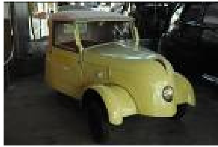
VLV, (Voiture Electrique de Ville)