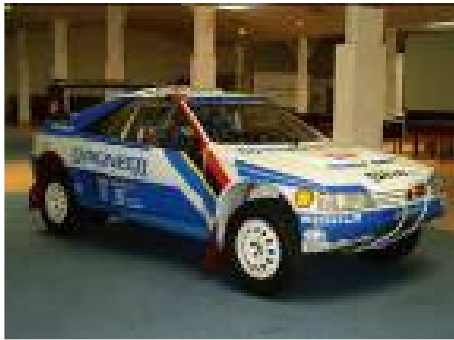
405 T Grand Raid

Par ailleurs, les maquettes de présentation des F1 Jordan et Prost ont été adjugées dans une fourchette de 12 000 à 26 000€ .