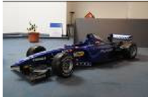
Maquettes de Prost F1

Dans un souci festif et convivial, les responsables de l'Aventure Peugeot avaient accepté d'ouvrir les portes de la vente aux propriétaires de véhicules de la marque souhaitant les réaliser.