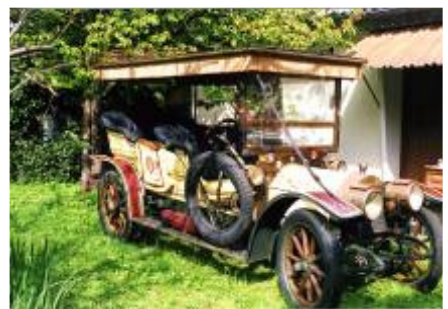
Torpedo de 1911

En début de vente, 25 lots d'automobilia étaient proposés aux amateurs de la firme, par exemple, un bouchon de radiateur représentant le lion Peugeot par Marx a été emporté pour 4 600€ et un pastel de l'artiste britannique Brian de Grimeau (1882-1957) représentant le Grand Prix de la Sarthe de 1912 regagnant son pays d'origine pour 5 200€ .