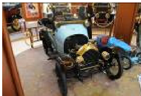
BB de 1913