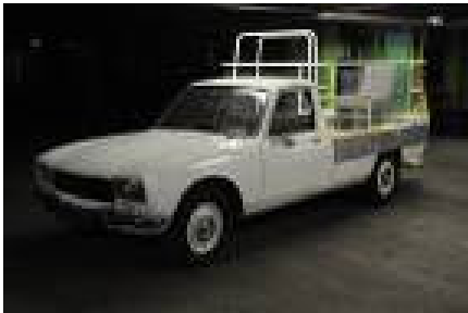
504 type « Papamobile »

Le prototype OXIA , formidable vitrine technologique de la Maison a quant à lui triplé ses estimations à 141 500€ et prend la route des Etats-Unis.