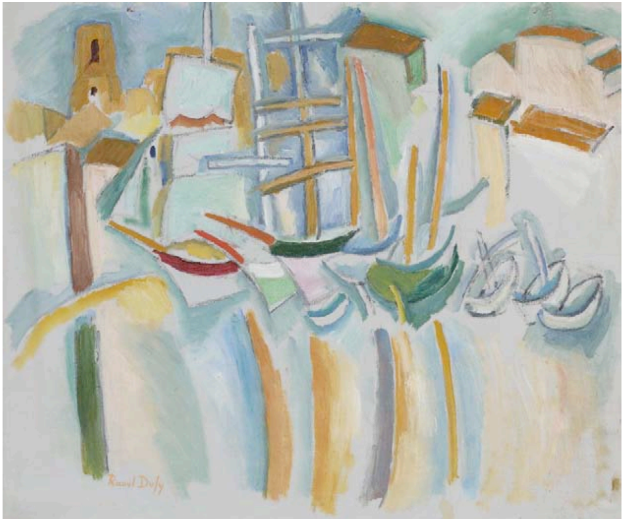
Raoul Dufy, Barques et bateaux aux Martigues , 1907-1908, 644 800 € (est. 500 000-700 000 €, n°29)

Pièce maîtresse de la période fauve de Raoul Dufy , Barques et bateaux aux Martigues , toile de 1907-1908 remporte la plus haute enchère de la vacation avec 644 800 euros (est.500 000-700 000 €, n°29), achat d'un collectionneur français.