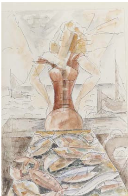
Marcel Gromaire, La marchande de poisson , 1966, 7 000 € (est. 5 000-7 000 €, n°108)