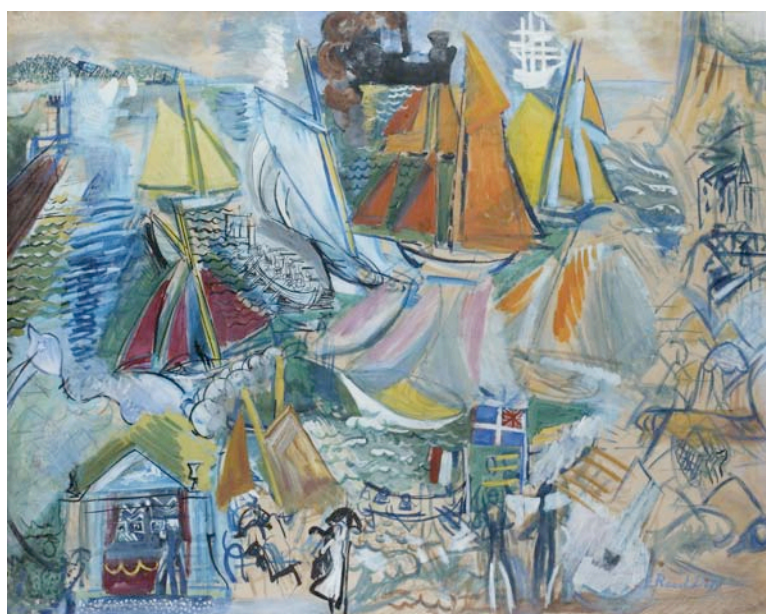
Raoul Dufy, Visite de l'escadre anglaise au Havre , 1927-29, 471 400 € (est. 230 000-350 000 €, n°8)

Les estimations ont flambé pour les œuvres sur papier à l'exemple de Nature morte au jardin de Saint-Emilion , aquarelle et gouache de 1940, qui s'est envolée à 198 810 € sur une estimation de 30 000-40 000 € (n°22), ou encore Vente à l'Hôtel Drouot , gouache, encre et mine de plomb de 1934, partie à 124 458 € (est.30 000-40 000 €, n°2).