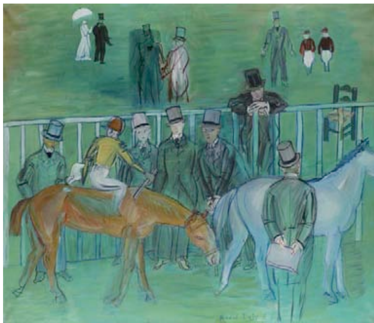
Raoul Dufy, Scène de Pesage , 1949, 570 600 € (est. 450 000-650 000 €, n°30)

Les scènes hippiques ont particulièrement séduit les enchérisseurs comme l'illustrent les 570 600 euros (est.450 000-650 000 €, n°30) obtenus par Scène de Pesage , huile sur toile de 1949, achat du marché anglo-saxon contre un sous-enchérisseur libanais.