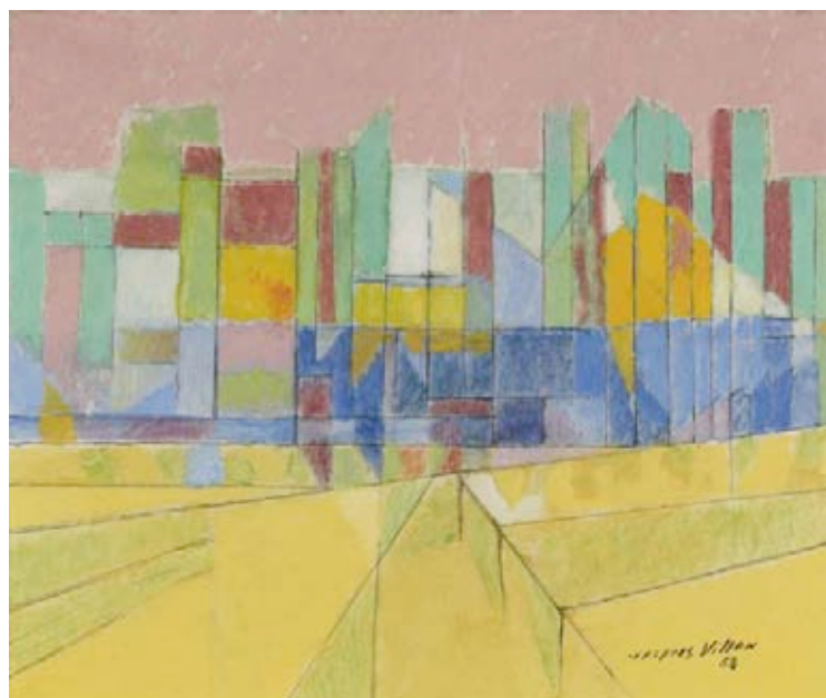
Jacques Villon, A l'orée du bois , 1958, 31 500 € (est.20 000-30 000 €, n°89)