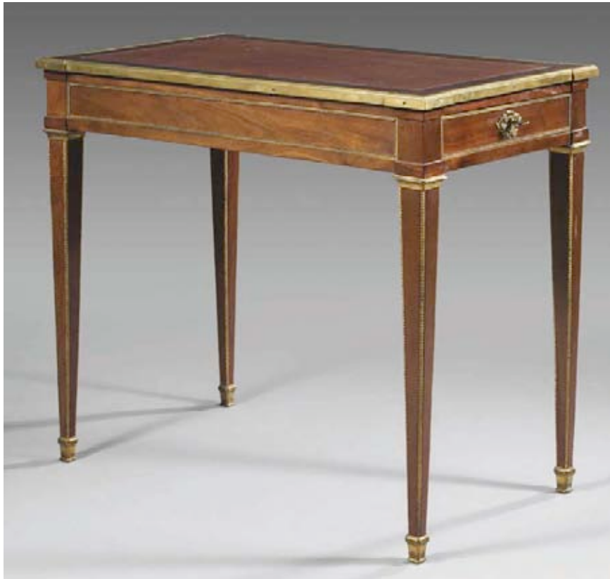
Table à écrire d'époque Louis XVI, estampille de Roger Van Der Cruse dit Lacroix, 25 300 € (est. 12 000-18 000 €, n°293)

Un chevalet en plexiglas et métal, XXe siècle, a été propulsé à 2 800 € (est. 200-220 €, n°319).