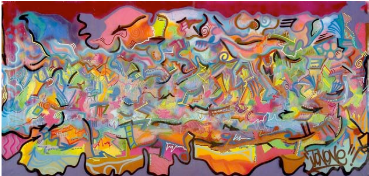
JonOne, Le départ (Mme Protis) , 1994, peinture aérosol et acrylique sur toile, 35 200 € (est.20-30 000 €, n°237) Record mondial pour une œuvre de l'artiste