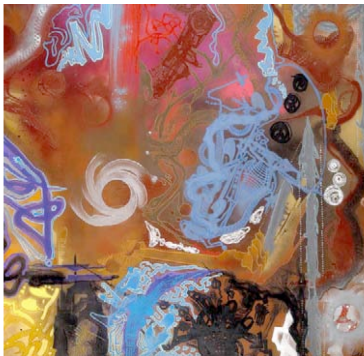
Shuck One, Organes scientific's , 2001, acrylique et peinture aérosol sur toile, 10 800 € (est.6-8 000 €, n°238)

Enfin, mentionnons Invader , dont le travail est centré sur la pixellisation de l'image, présent dans la vente avec Rubik little cartman , 2008, emporté 6 400 € (est.5-6 000 €, n°263).