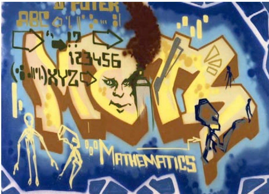
Dondi White, Mathematics , 1984-1985, peinture aérosol sur toile, 19 100 € (est. 15-20 000 €, n°201)

Dondi White , personnage central du mouvement Graffiti, considéré comme l'un des meilleurs writers du milieu, obtenait 19 100 € avec Mathematics , 1984-85, peinture aérosol sur toile (est.15-20 000 €, n°201).