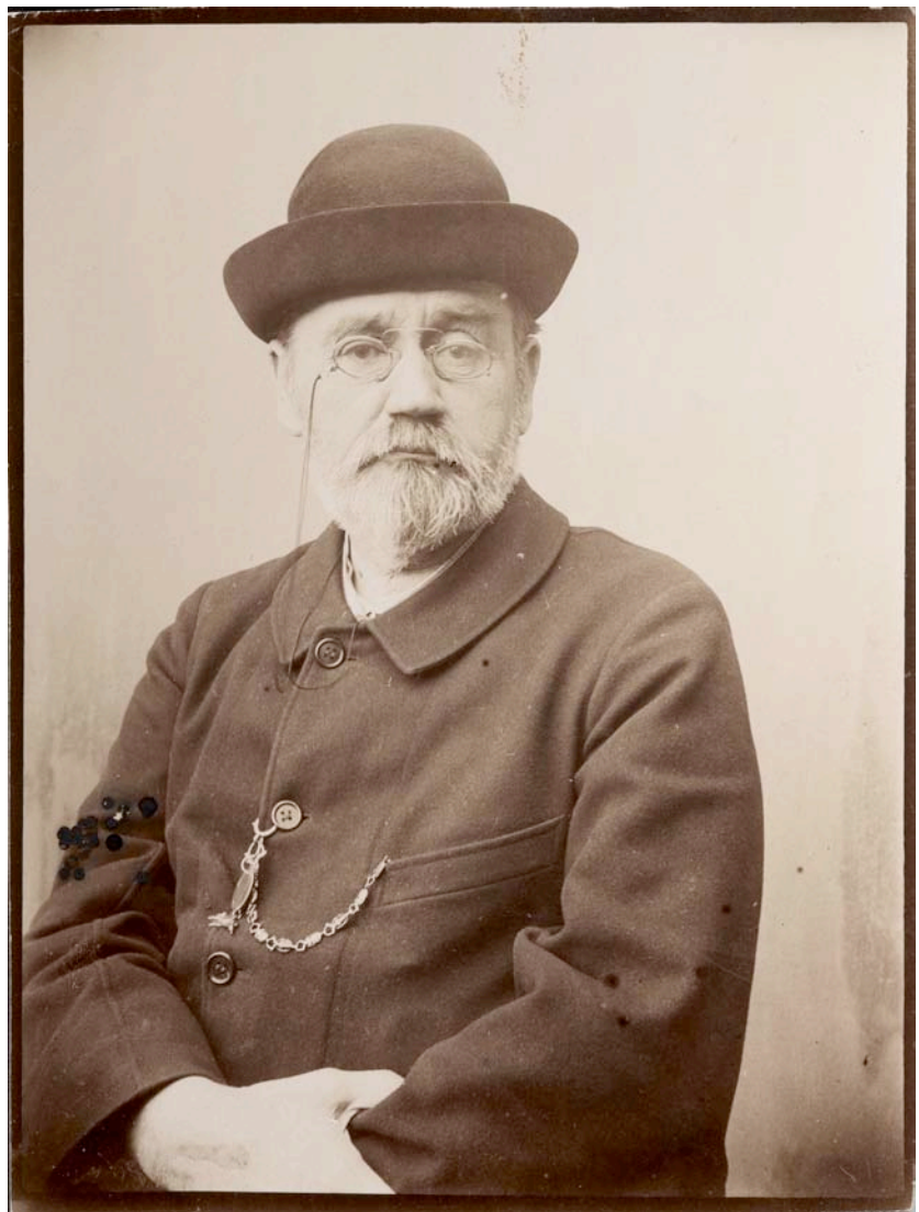
Emile Zola, Autoportrait , photographie originale, tirage argentique d'époque, vers 1896-1897, provenant de la Famille Zola, Est : 1000-1500 €