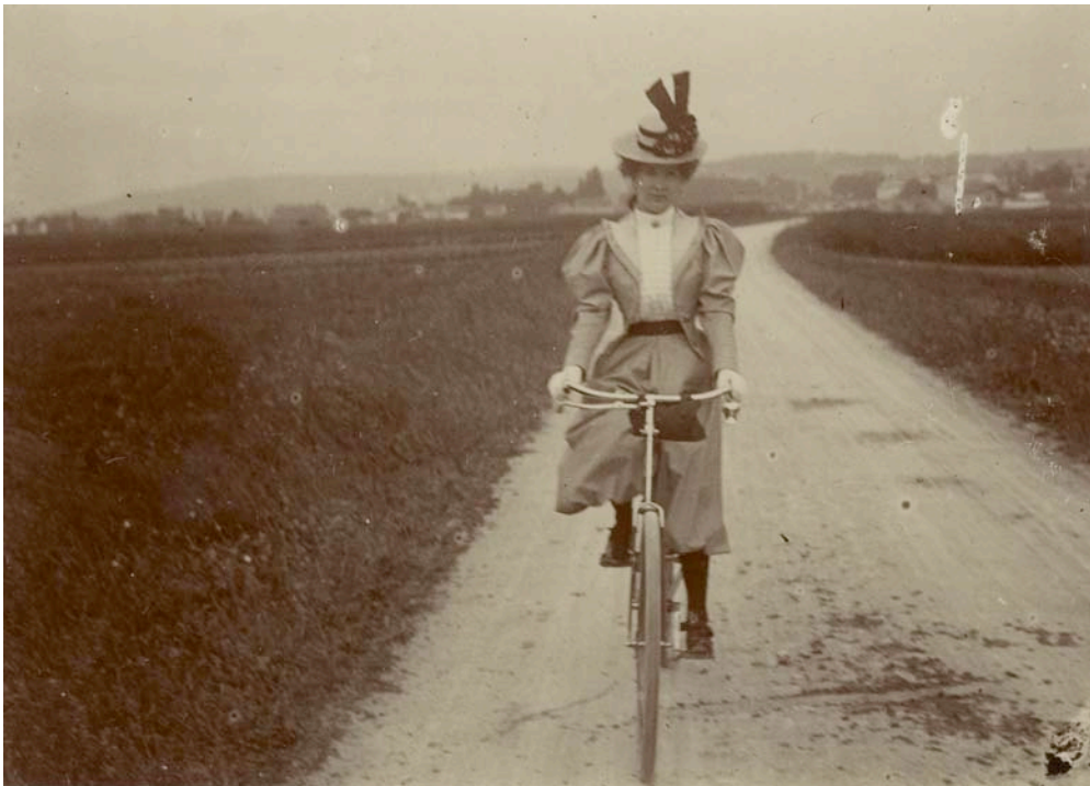
Emile Zola, Madame Zola à bicyclette , été 1899, photographie originale, tirage papier citrate d'époque, Est : 800-1000 €