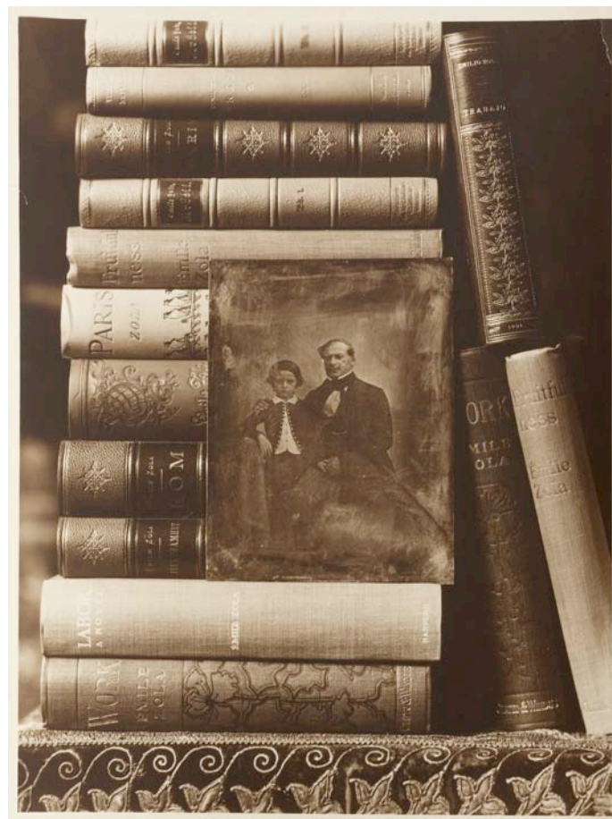
Emile Zola, Nature morte aux livres , tirage argentique d'époque, 1901-1902, composition de Zola, Est : 1500-2000 €

Zola est photographe comme il est écrivain : à la recherche de la vérité. Il écarte les accessoires, refuse les poses théâtrales alors à la mode, ne pratique aucune retouche. Sa recherche concerne avant tout le cadrage ou la perspective, et il explore tous les formats. Il utilise tantôt les plaques, tantôt la pellicule qui vient de faire son apparition. Il prend des instantanés, mais joue aussi avec les temps de pose, et opère par tous les temps.